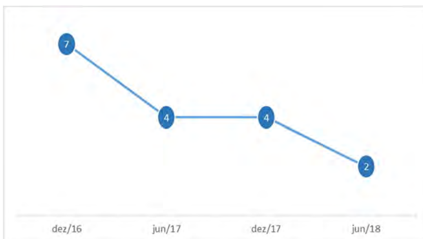
GRÁFICO 2 – PRAZO MÉDIO DE PAGAMENTOS (DIAS)

Conforme se pode verificar no gráfico anterior o Município da Chamusca tem conseguido reduzir o seu prazo medio de pagamentos, que a 30-06-2018 era de 2 dias, ao conseguir estabilizar as aquisições e diminuir as dívidas a fornecedores.